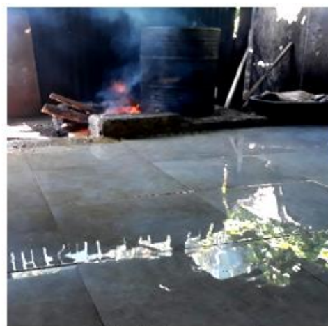
b. Setelah renovasi