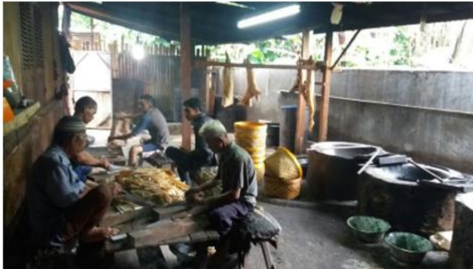
Gambar 1. Ruang produksi kerupuk kulit Aulia.

lam kegiatan produksi. Selanjutnya, deskripsi dalam peraturan ini dirangkum dalam Peraturan Kepala Badan Pengawas Obat dan Makanan Republik Indonesia Nomor HK.03.1.23.04.12.2207 Tahun 2012 tentang Tata Cara Pemeriksaan Sarana Produksi Pangan Industri Rumah Tangga (BPOM, 2012b).