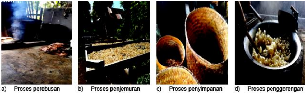
Gambar 3. Proses pengolahan kerupuk kulit.