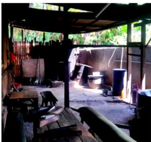
a. Sebelum renovasi

Sebelumnya ruang produksi di bagian lantainya hanya dilapisi dengan semen (Gambar 4a) yang sudah tidak