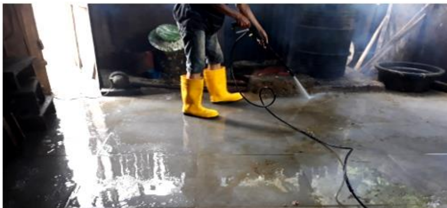
Gambar 6. Penggunaan alat pembersih.