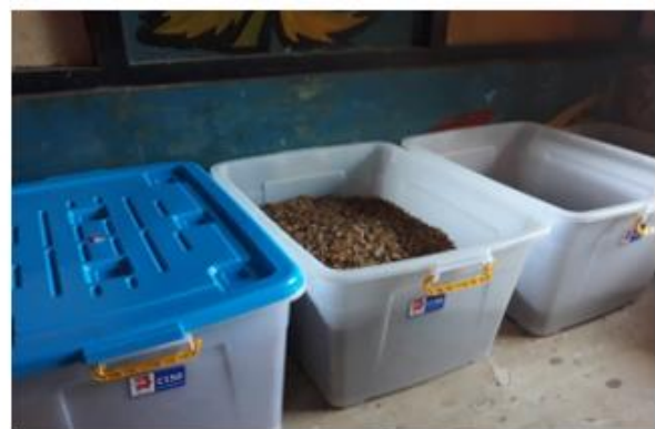
b. Sesudah renovasi