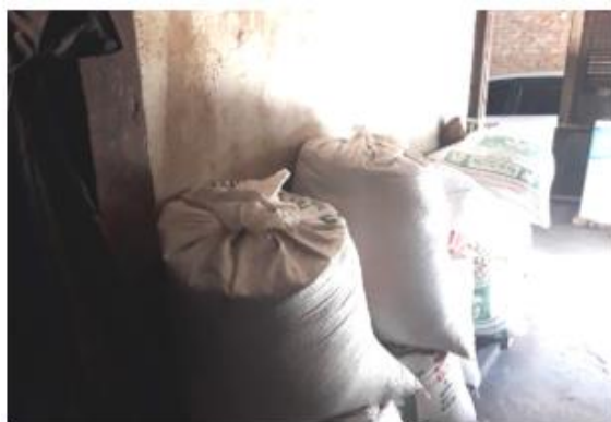
a. Sebelum renovasi

Untuk menjamin kebersihan dalam penyimpanan, maka tim pengabdian menyediakan box container yang bisa menyimpan kerupuk siap jemur didalamnya (Gambar 5b). Hal ini akan memberikan tingkat kebersihan dan enak dipandang. Menurut Atmoko (2017), bahwa wadah yang digunakan harus utuh untuk menghindari kontaminasi serangga, debu dan bakteri. Selain itu,