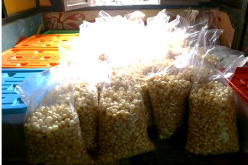
Gambar 7. Ruang pemasaran produk.

krupuk kulit Aulia di Kabupaten Agam telah memberikan dampak positif terhadap Mitra berupa alih teknologi melalui desain layout dan renovasi ruang produksi yang memenuhi standar kebersihan serta penggunaan alat penyimpanan, alat kebersihan pekerja dan industry dan display ruang pemasaran. Dampak utama dari pengabdian ini adalah produk kerupuk kulit yang dihasilkan lebih higienis dari penerapan sanitasi yang tepat sehingga lebih bermutu.